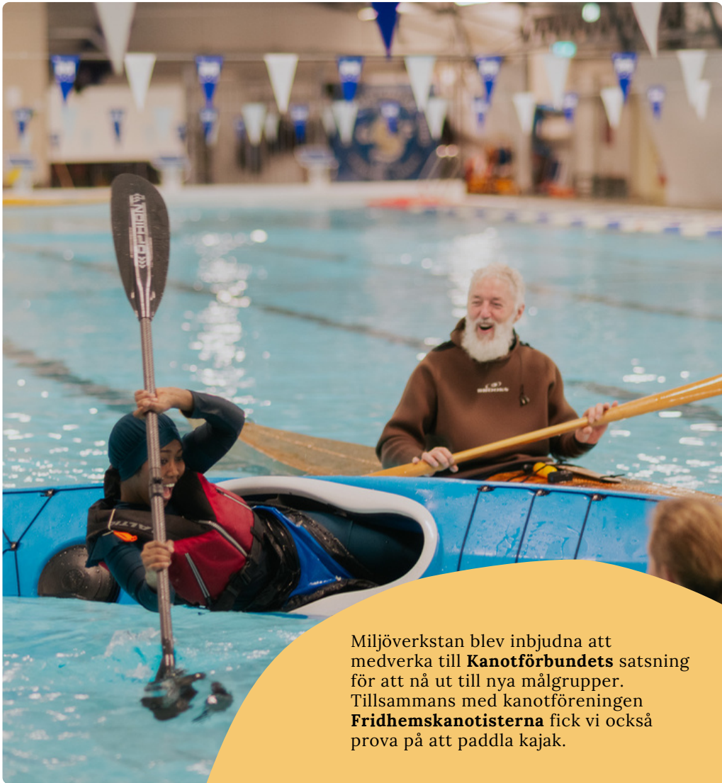
Miljöverkstan blev inbjudna att medverka till Kanotförbundets satsning för att nå ut till nya målgrupper. Tillsammans med kanotföreningen Fridhemskanotisterna fick vi också prova på att paddla kajak.