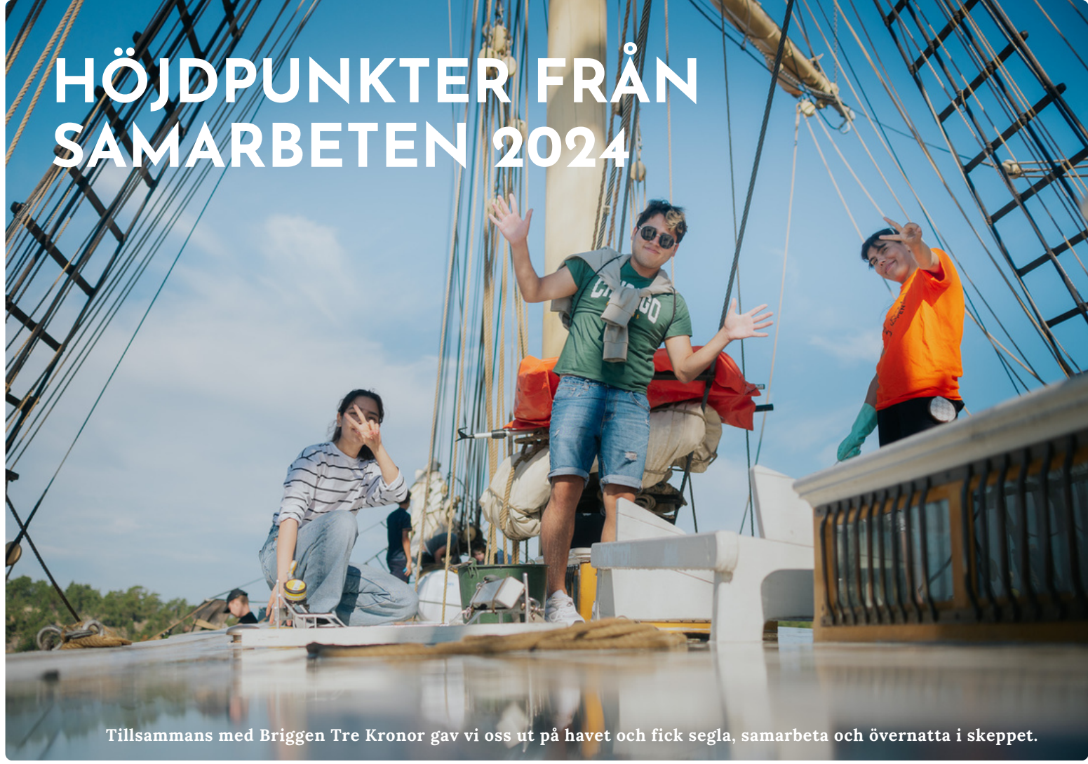
Tillsammans med Briggen Tre Kronor gav vi oss ut på havet och fick segla, samarbeta och övernatta i skeppet.